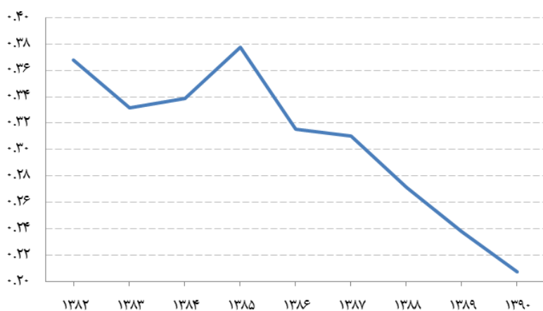
شکل ۲- نسبت ارزش افزوده بخش پوشاک و کفش به هزینه پوشاک و کفش خانوارها (سالانه)

همان‌گونه که آمار و ارقام بالا نشان می‌دهند، خانوارهای ایرانی سالانه هزینه‌های قابل توجهی را صرف خرید پوشاک و کفش می‌کنند ولی این هزینه‌ها موجب رونق در بخش صنایع نساجی، پوشاک و چرم نشده است. از این رو به راحتی می‌توان نتیجه گرفت بخش عمده‌ای از این هزینه‌ها صرف واردات رسمی یا غیر رسمی پوشاک و کفش از خارج از کشور می‌شود. بدیهی است اگر مردم برای اصلاح فرهنگ مصرف کالای خارجی به کمک دولت بیایند و دولت برنامه‌های حمایت از تولید پوشاک و کفش داخلی را به عزم ملی تبدیل نماید، با هدایت هزینه‌های خرید پوشاک و کفش به سمت تولید داخلی، در کوتاه مدت بدون سرمایه‌گذاری جدید، شاهد رونق در بخش صنایع نساجی، پوشاک و چرم خواهیم بود.