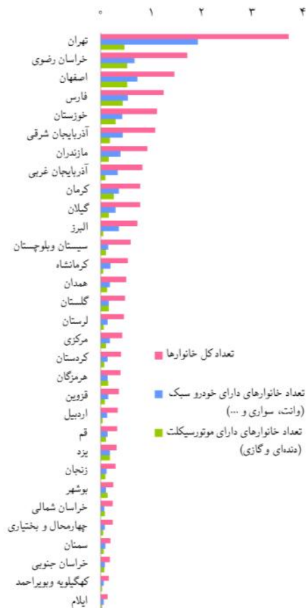
شکل ۱- تعداد خانوارهای معمولی ساکن بر حسب در اختیار داشتن موتورسیکلت و خودرو سبک به تفکیک استان در سال ۱۳۹۰